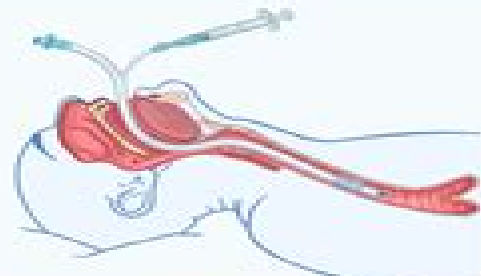
ENDOTRACHEAL AIRWAY (ETA) with INTUBATION