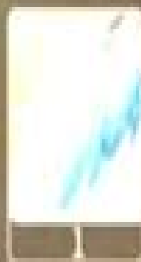
Premium Aspect: Dawn upon Thorns (Glide)