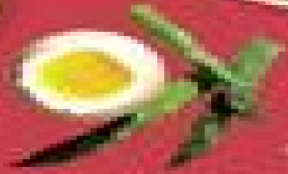
Œuf sur pain grillé