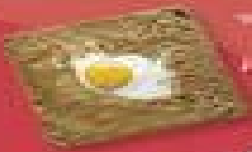
Œuf sur pain grillé