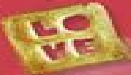
Pain à Liège