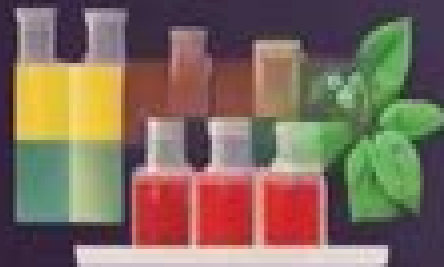
Organische Chemie ist die Lehre von den Kohlenstoffverbindungen und ihren Eigenschaften.