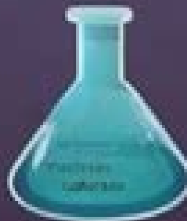
Organische Chemie ist die Lehre von den Kohlenstoffverbindungen und ihren Eigenschaften.